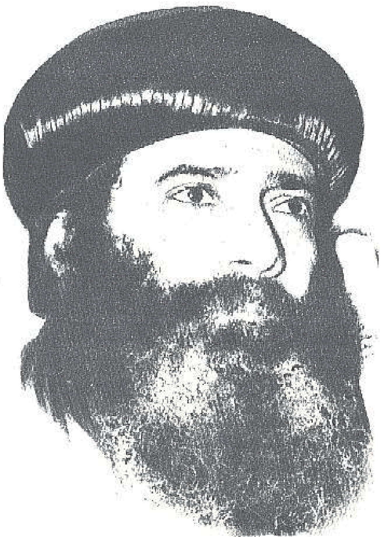
عمارة عمارة الفيلسوف والفقيه الابا شتودة الثالث بابا الإسكندرية ويطن يسرى الكرازة الرئيسة