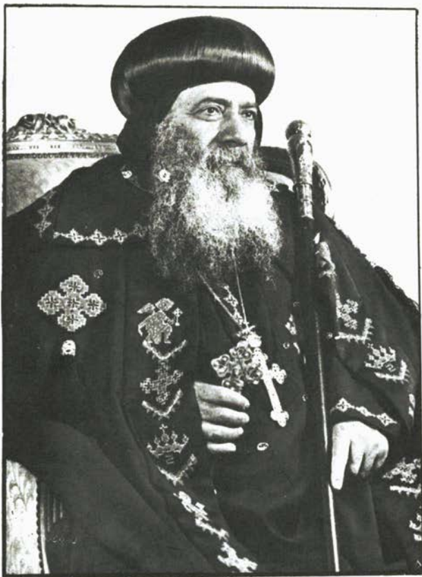
قداسة البابا شنوده الثالث بابا الإسكندرية وبطريك الكرازة المرقسية