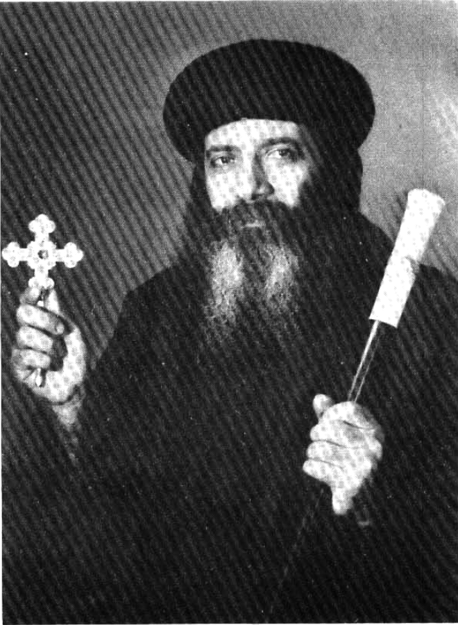
قداسة البابا شنوده الثالث